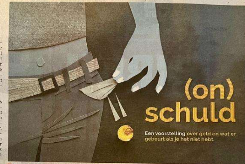
Armoede wordt bespreekbaar gemaakt tijdens de Dag van de Armoede op 17 oktober.